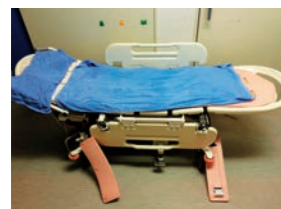
◀ 患者さんをこのようなベッド型装置に移して入浴してもらいます

まずはじめに利用者さんの着替えをお手伝いします。中には、ご自身で動くことが困難な利用者さんがいますので、専用のような入浴用ベッドに移っていただいてから入浴します。