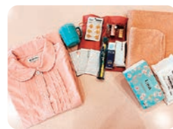
アメニティセットを使えば荷物は最小限でOK!